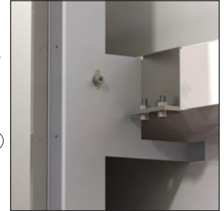
Nei disegni A o B indicano il lato preverniciato desiderato. In the drawings A or B show the wished pre-painted side.