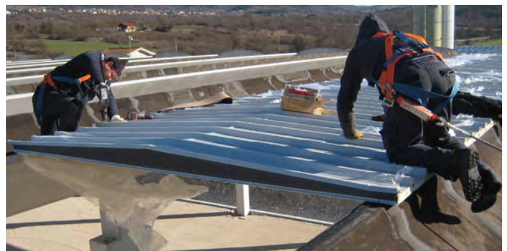
Techtum™ si distingue per la sua facilità e rapidità di posa. Techtum™ stands out for its ease and quick laying.

TECHTUM™ is made with two ribbed metal supports, among which is foamed, in continuous process, a compact layer of high density closed cell polyurethane (density: 40 Kg / m 3 ). TECHTUM™ is available in the standard (PUR) or in the (PIR) with improved performance. The excellent performances of this product, are ensured with its innovative and patented production system in a continuous process: it provides a monolithic structure of the sandwich and a considerable mass of the insulation core.